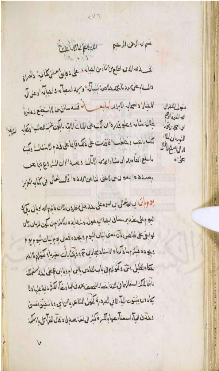
اللوحة الأولى: وجه: ب [١٣٧/ب]