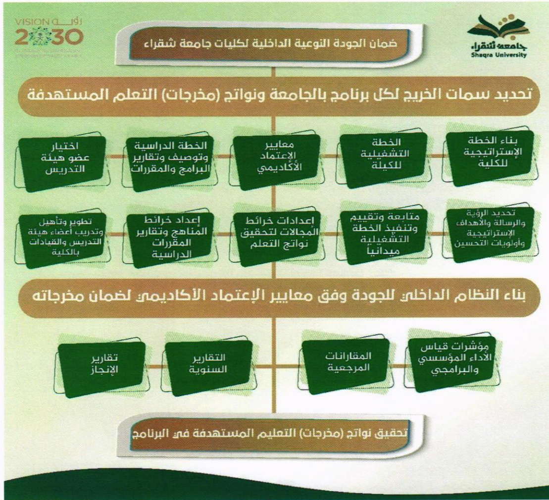
شكل: ١ منظومة ضمان الجودة النوعية الداخلية بالكليات (عمادة التطوير والجودة)

وضعت عمادة التطوير والجودة بالجامعة إطاراً عاماً للعمل به يمثل منظومة لضمان الجودة النوعية الداخلية لكليات جامعة شقراء، وتعمل وفق ذلك وهو الموضح بالشكل رقم (١)